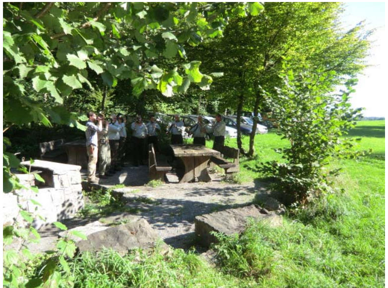
Jagdhornbläser beim Rastplatz Dachs

Sollte das Holz zu nass sein und es will kein Grillfeuer entstehen oder haben Sie gar die Würste zu Hause gelassen, besuchen Sie die Besenbeiz "Hüslimatt" in der Nähe. Vorbehältlich von Ferienzeiten ist sie an Sonntagen ab 11.00 Uhr geöffnet. Informationen erhalten Sie auf der Website: www.hugos-lamabeizli.ch